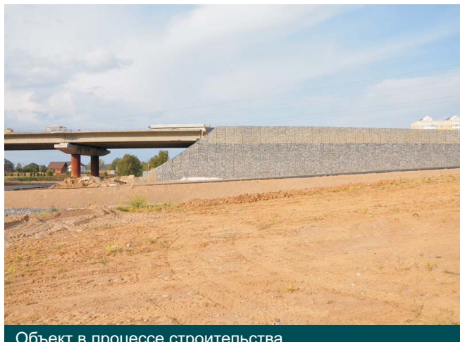
Объект в процессе строительства