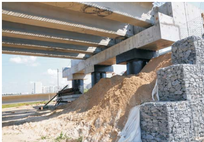
Объект в процессе строительства