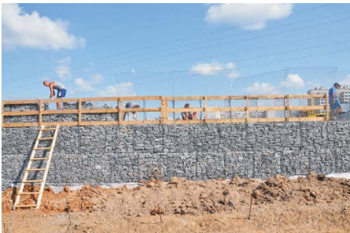
Объект в процессе строительства