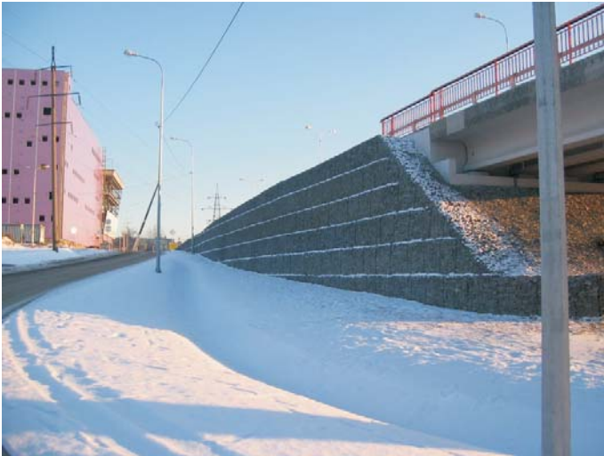
Объект по окончании строительства