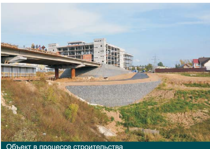
Объект в процессе строительства