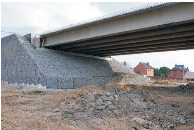
Объект в процессе строительства