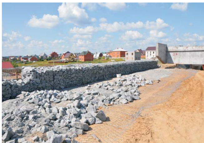
Объект в процессе строительства