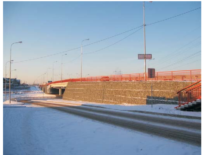
Объект в процессе эксплуатации