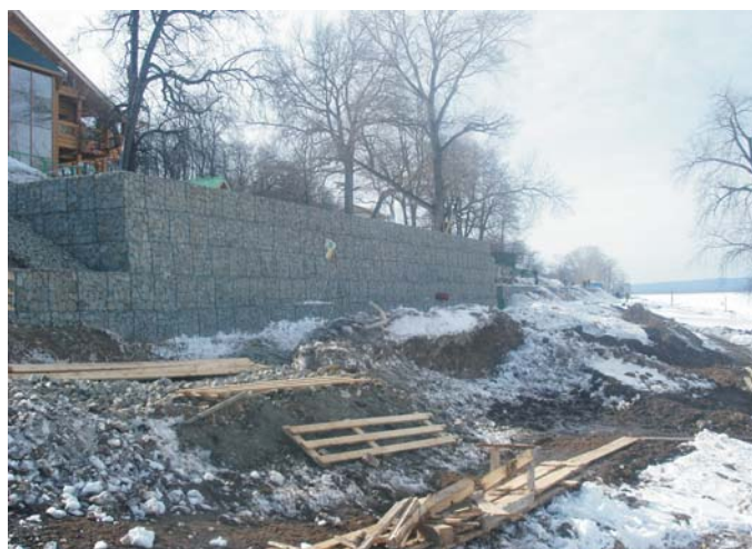
В процессе строительства