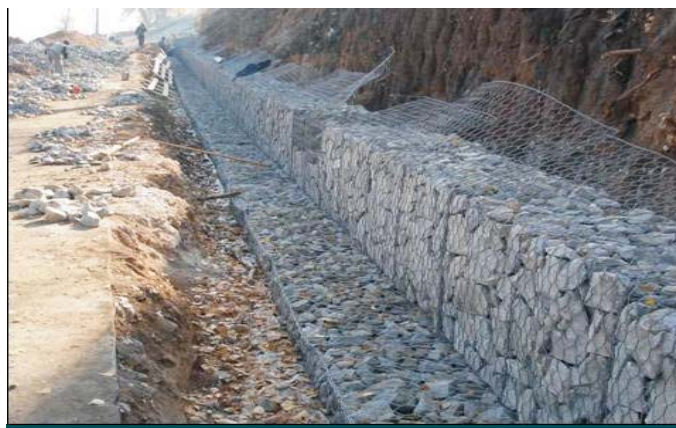
В начале строительства

Строители частного объекта расположенного на берегу реки Волга в Самарской области столкнулись с проблемой поиска эффективного решения по обеспечению общей устойчивости откоса и защите склона от поверхностной и эрозии. Более 200 м склоновой части, сложенной слабыми грунтами принимали на себя воздействия ежегодного снеготаяния, выпадение осадков. В результате возведения на склоне частного владения, в силу появившихся внешних нагрузок эрозионные процессы сильно возросли, а сам склон нуждался в серьезном укреплении. Решение по защите должно было быть одновременно эффективным, экологически безопасным, а также дать возможность владельцам иметь использовать прибрежную зону и береговую линию в целях рекреации.