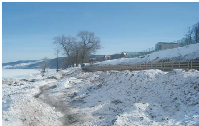
В процессе строительства

Для решения поставленной задачи была использована армогрунтовая конструкция система Террамеш. Расчёт армогрунтовой конструкции был выполнен с использованием программы MacStars_2000. Согласно расчетным данным для обеспечения достаточной устойчивости и надежности стенки высота которой составляет 6м, длина армогрунтовых панелей составила 3м Коэффициент общей устойчивости составил 1,533, что вполне допустимо по правилам проектирования подобных сооружений. Применение системы Террамеш одновременно обеспечивает эффективную защиту склона от эрозионных процессов, его укрепление и стабилизацию, сохранение существующей растительности, возможность возведения вертикального стенки, а также возможность организации лестничных спусков к воде в любом месте на всём протяжении укрепляемой части склона.