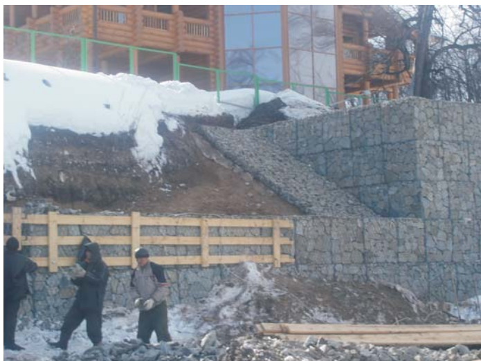
В процессе строительства