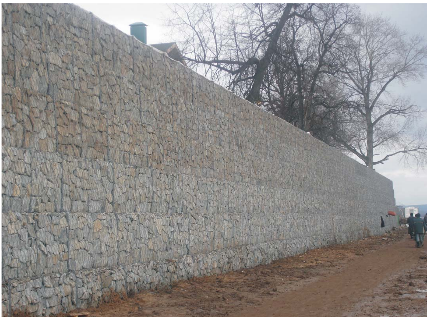
По окончании строительства