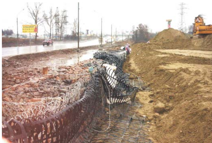
До начала строительства