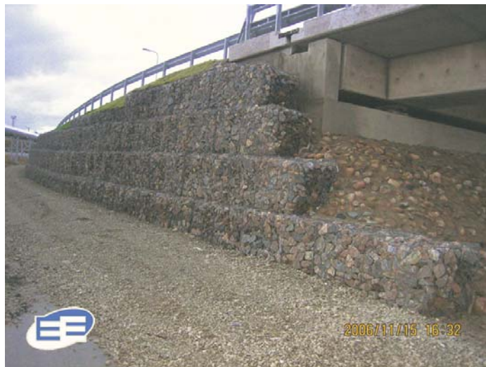
Портальная часть эстакады - в процессе строительства и по окончании работ