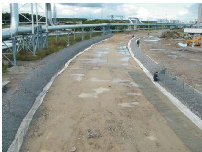
В процессе строительства