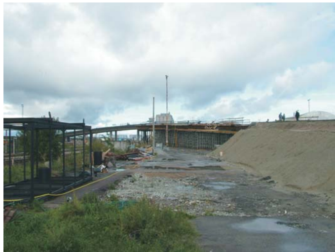
До начала строительства