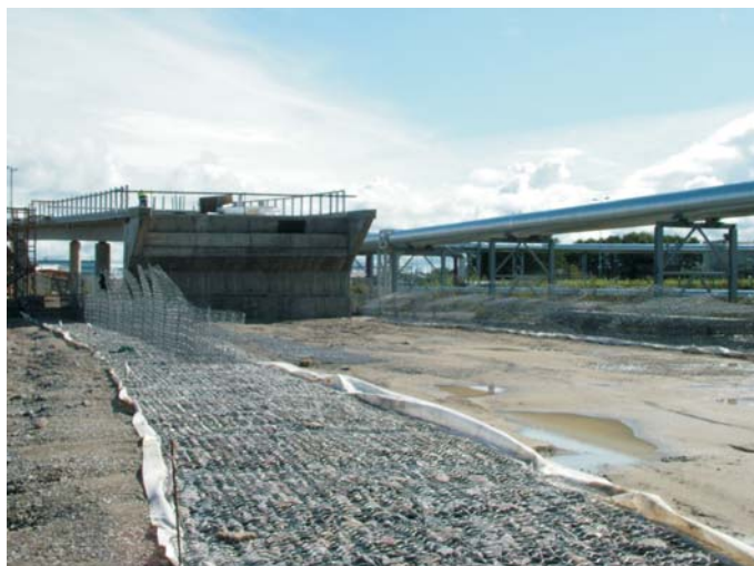
В процессе строительства