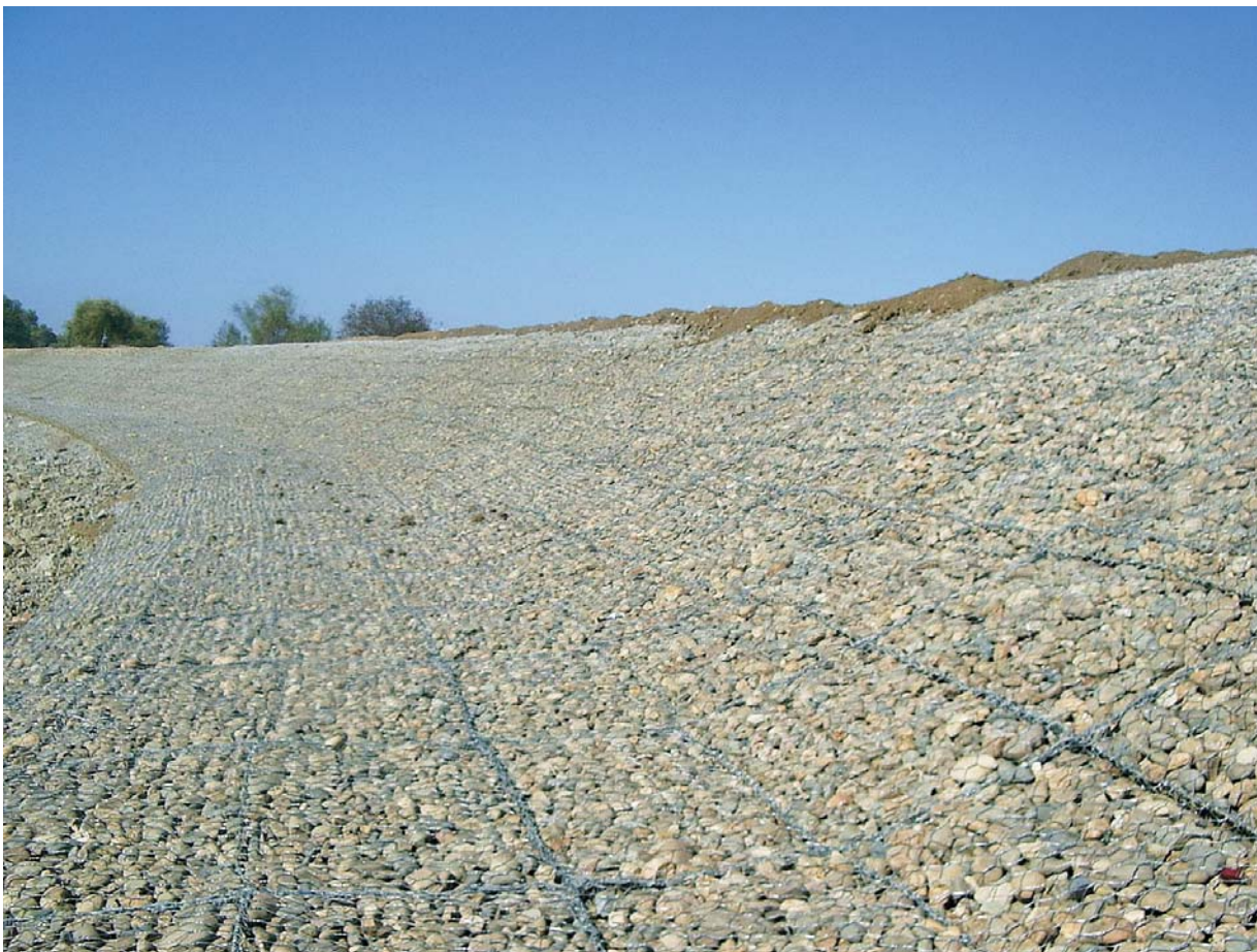
В настоящее время