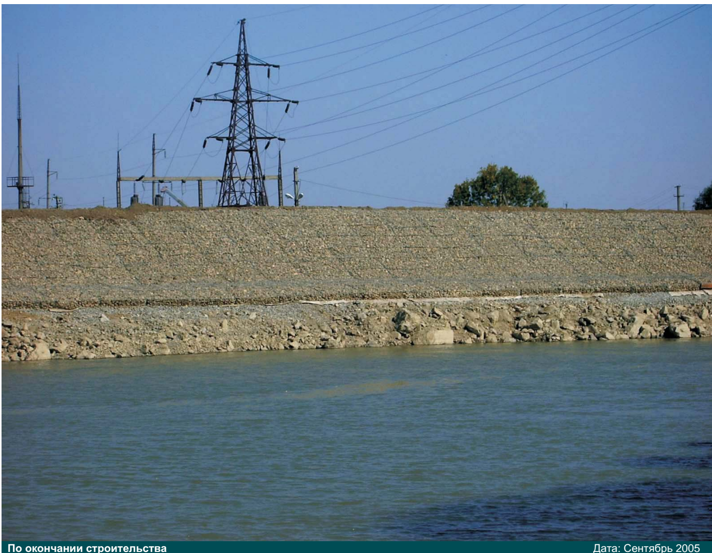
По окончании строительства