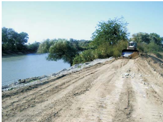
В начале строительства

Для защиты откоса было принято решение использовать матрацы Рено толщиной 30см, обеспечивающие эффективную защиту от эрозии. В качестве упора в нижней части откоса отсыпалась призма из рваного камня. Подрядные работы были выполнены ЗАО «Агрострой». Работы выполнялись в летнее время и продолжались в течение 3-х месяцев. Длина крепления составила около 400 метров.