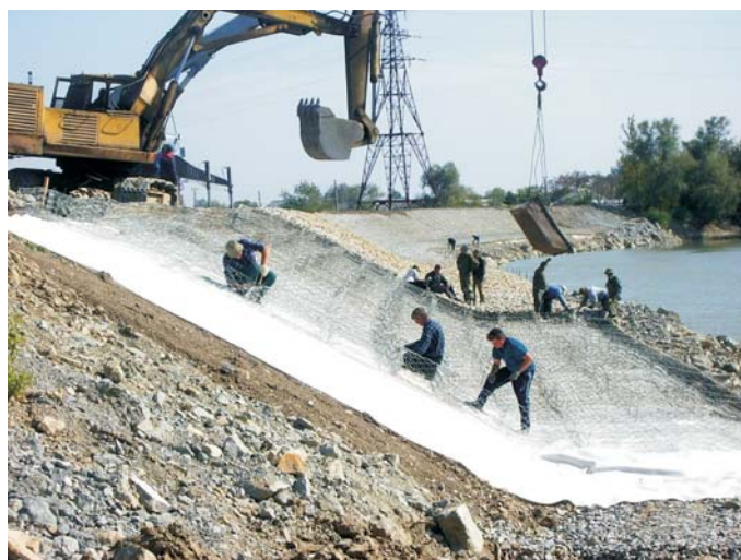
В процессе строительства