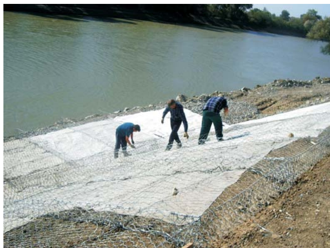
В процессе строительства