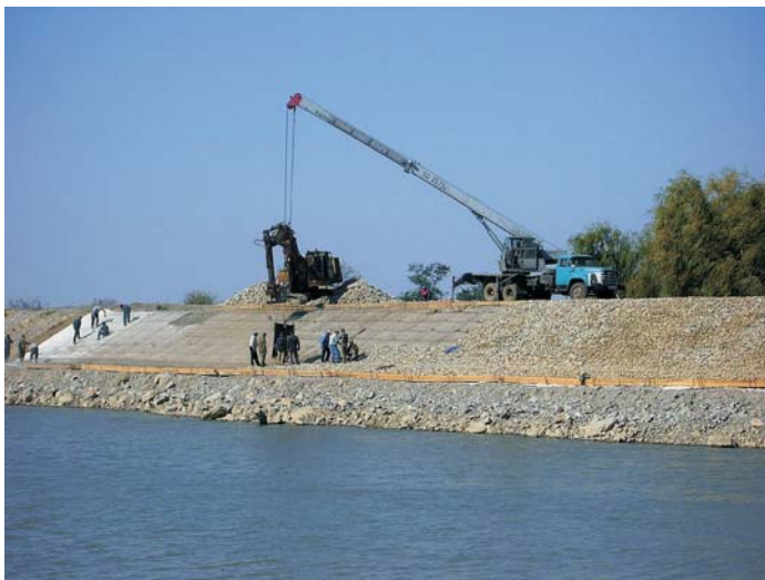
В процессе строительства