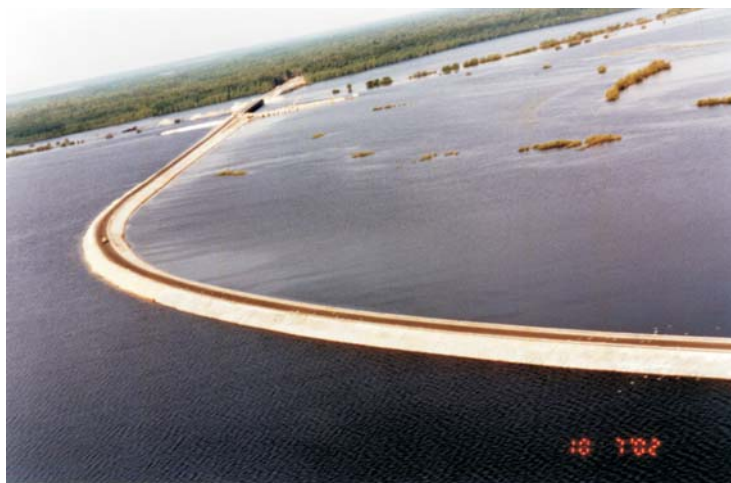
По окончании строительства / В настоящее время