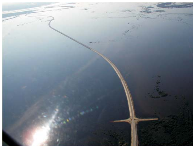
До начала строительства