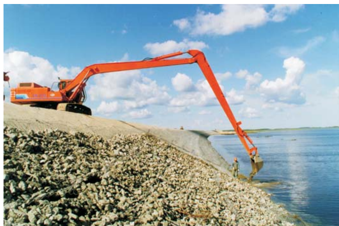
В процессе строительства