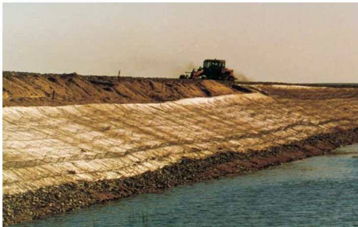
В процессе строительства