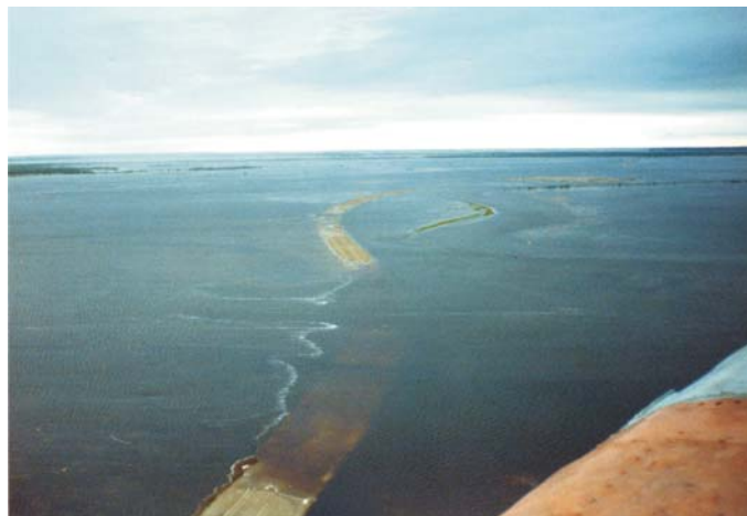
До начала строительства