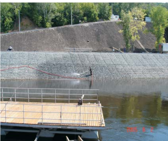
По окончании строительства