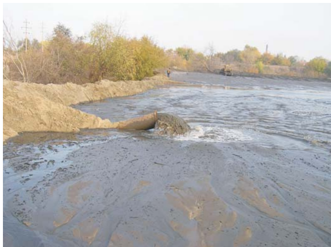
До начала строительства

Расчёт берегоукрепления, предоставленный заказчику, был проведён по нескольким типовым профилям, которые и были реализованы на практике. Один из типовых профилей вы можете найти на стр. 2.