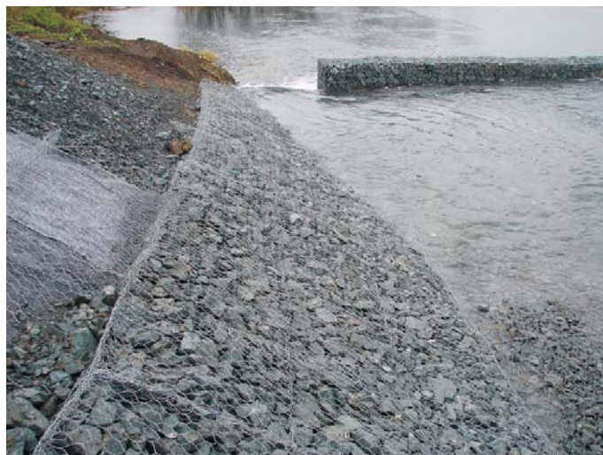
В процессе строительства