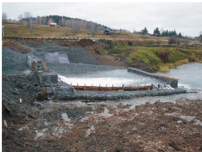
В процессе строительства