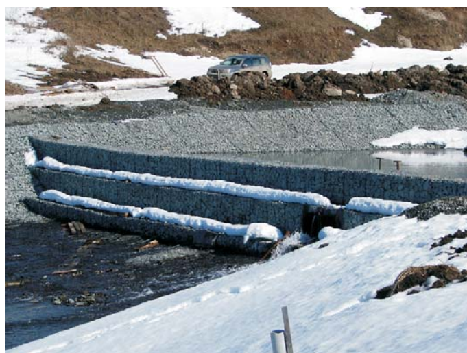
По окончании строительства