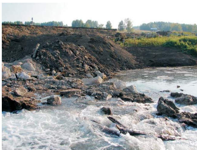
До начала строительства