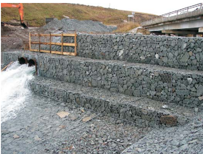
В процессе строительства