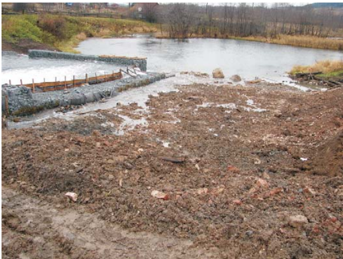
В процессе строительства