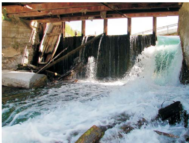
До начала строительства

Начало строительства: Май 2007 Окончание строительства: Май 2008