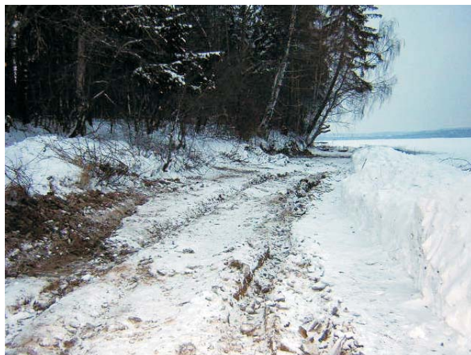
До начала строительства