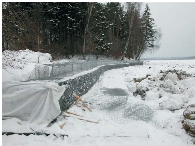
В процессе строительства