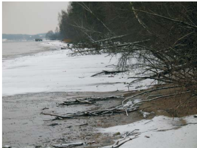
До начала строительства