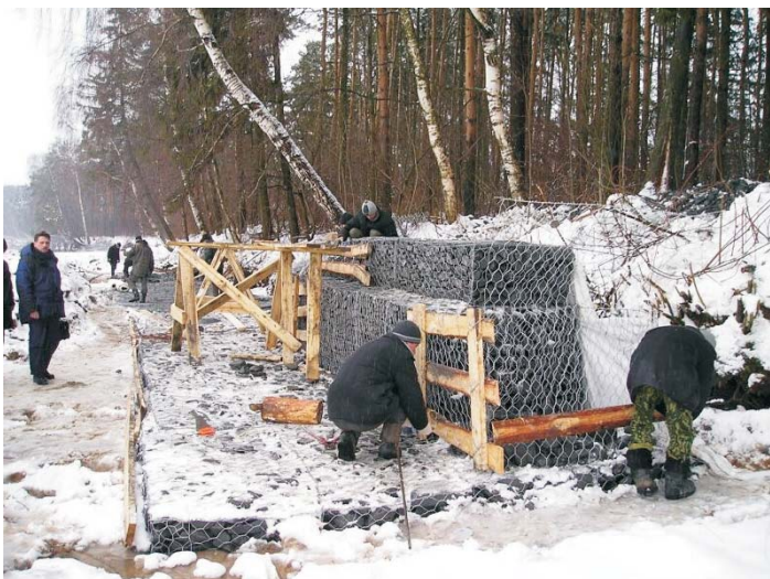
В процессе строительства