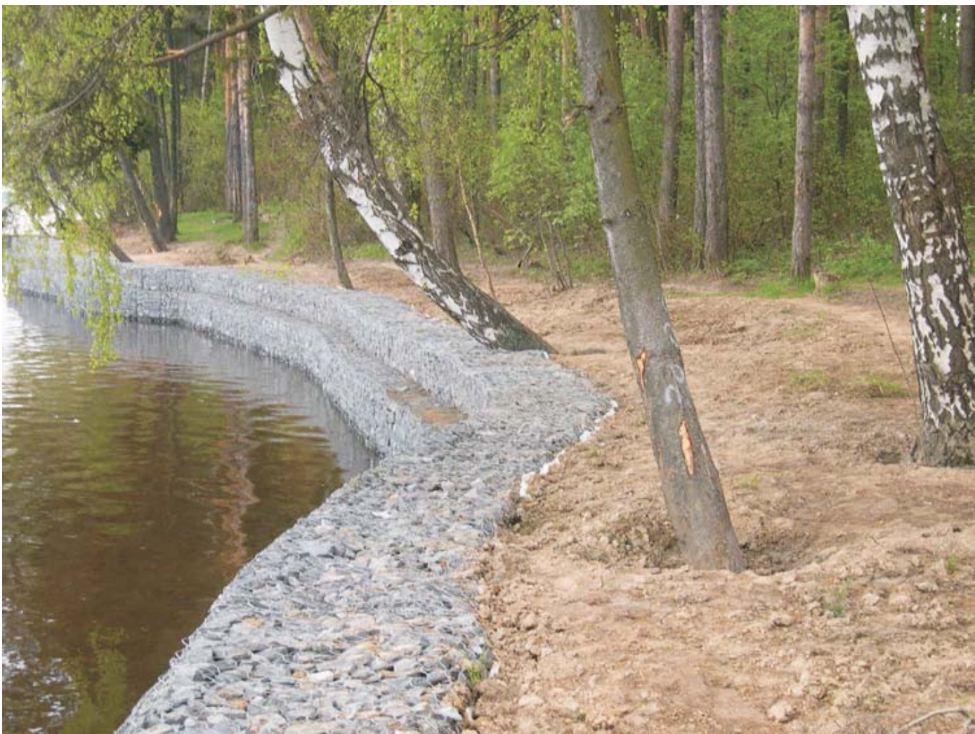
По окончании строительства