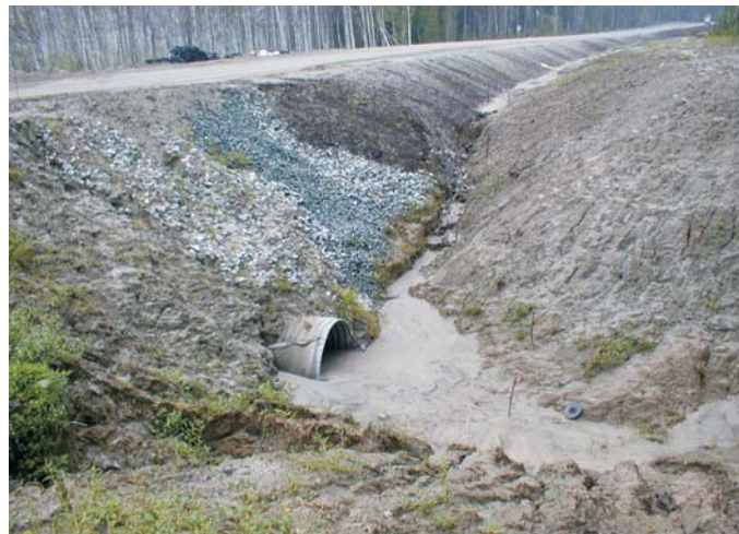
До начала строительства

Вариант укрепления подтопляемого откоса матрацами Рено был признан наиболее оптимальным. Конструкция предусматривает наличие фартука из матраца Рено длиной 3 м на предполагаемую глубину размыва. По всей площади откоса с заложением 1:3, матрацы анкеруются в грунт насыпи специальными анкерами. Данная конструкция одновременно обеспечивает эффективную защиту насыпи от подтопления, а также стабилизирует поверхностную часть насыпи.