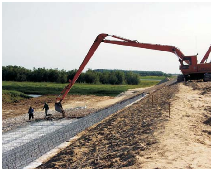
В процессе строительства