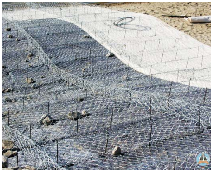
В процессе строительства