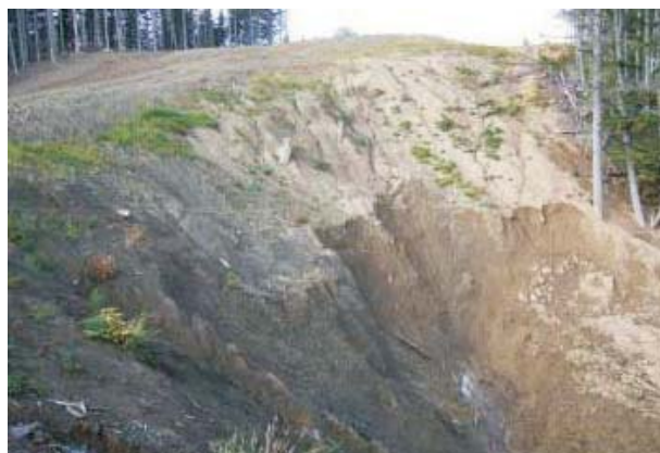
До начала строительства