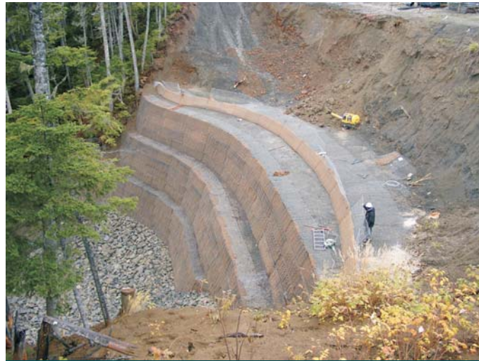
В процессе строительства