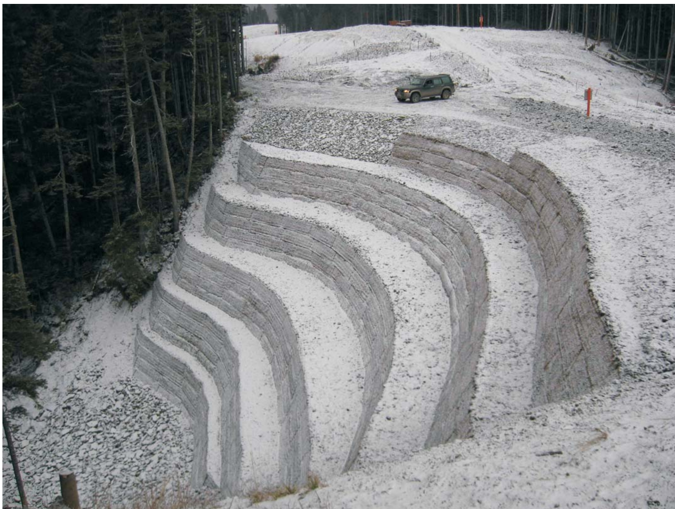
По окончании строительства