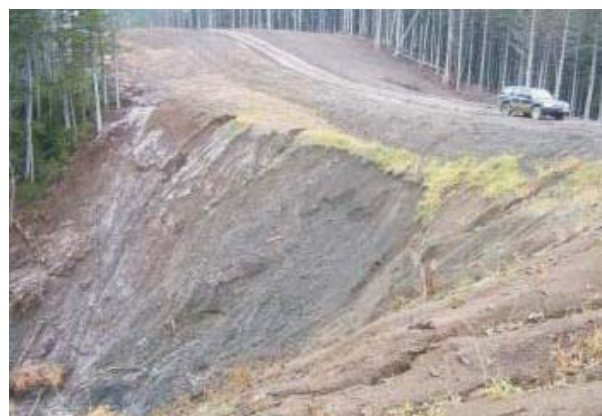
До начала строительства