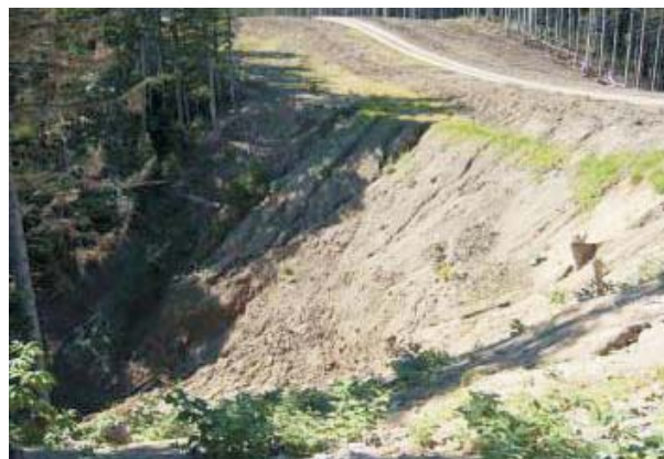
До начала строительства