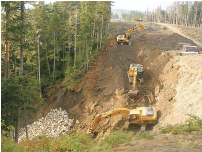
В процессе строительства