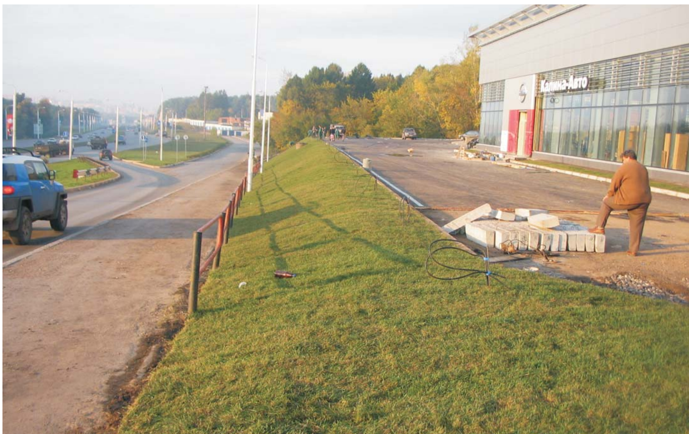
По окончании строительства