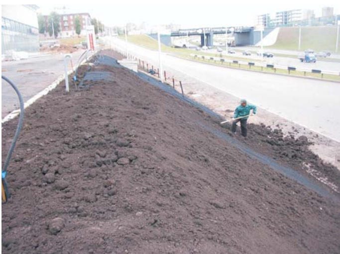
Засыпка материала Макмат-L грунтом