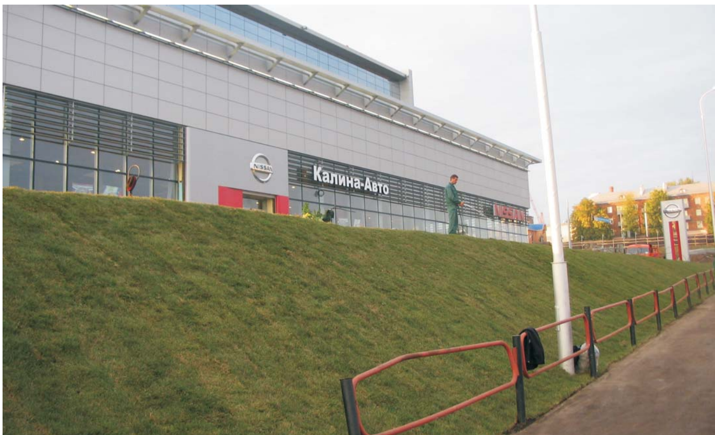
По окончании строительства