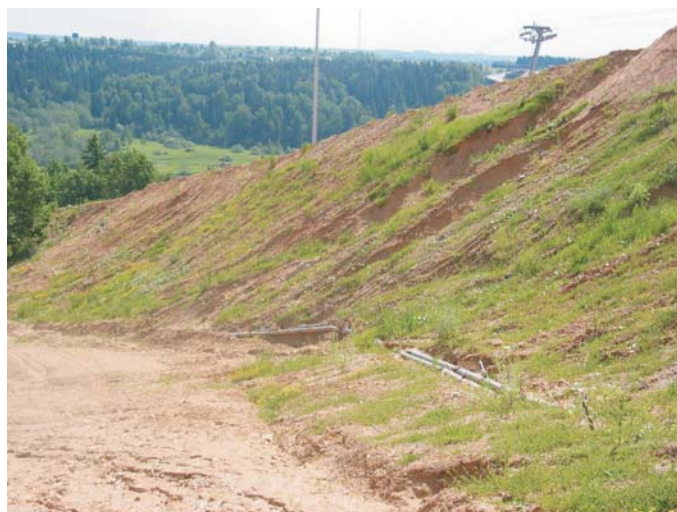
До начала строительства