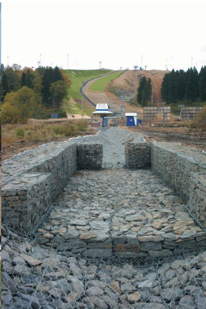
По окончании строительства