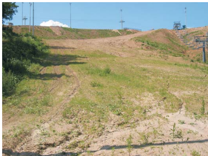
До начала строительства