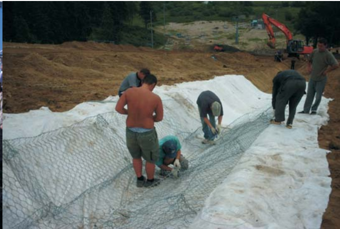
Дата: Август 2004