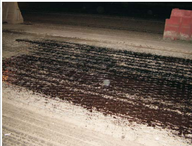
Анкеровка сетки Родмеш, её разравнивание и проливка битумной эмульсией (в ночное время)