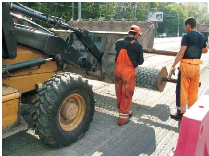
Раскатывание материала Родмеш