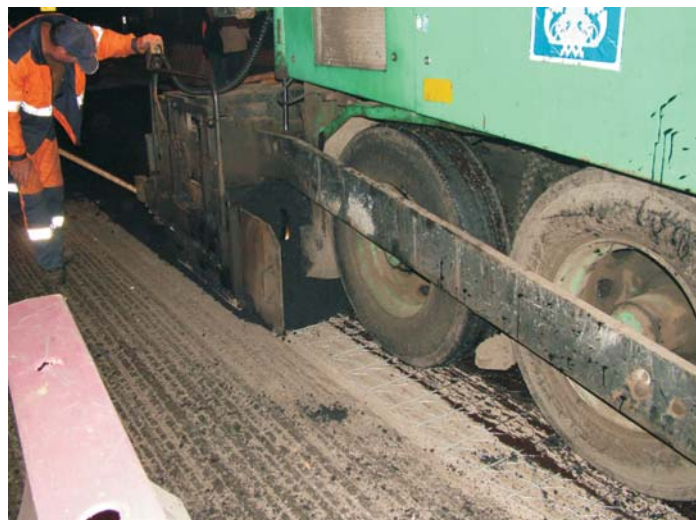
Укладка асфальтобетонного покрытия с использованием колёсного асфальтоукладчика (в ночное время)