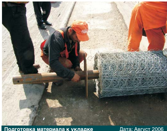
Подготовка материала к укладке