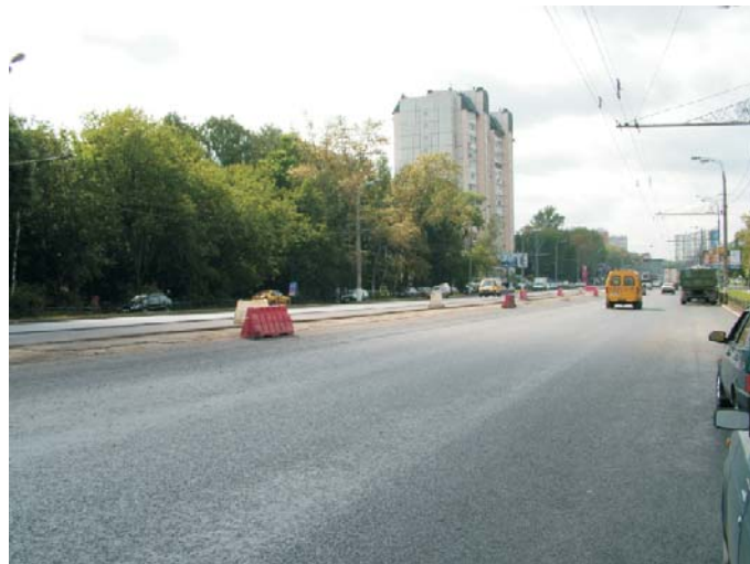
До начала ремонтных работ

Для решения проблем образования отражённых трещин и появления колеиности на данном участке трассы, было принято решение использовать материал Родмеш в качестве армирующего слоя. Материал был уложен в основании укладываемого асфальтобетонного покрытия, надёжно разровнен и заанкерован с помощью специальных монтажных пистолетов и анкерных пластин. Асфальт представлял собой новый тип асфальтобетонной смеси - ЩМА, которая за счёт большей вязкости предъявляет повышенные требования к качеству укладки сетки Родмеш, проведённой на высоком профессиональном уровне.