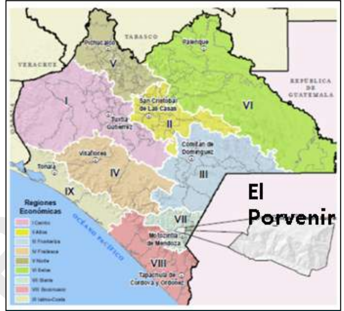
Fig 2. Ubicación "El Porvenir", Chiapas

Sistema Terramesh® : Compuesto por refuerzos en malla hexagonal a doble torsión asociados a un paramento frontal formado por la misma malla y piedras, formando cajas (puede presentar un paramento vertical o escalonado).