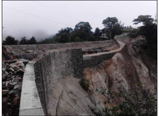
Fig 6. Avance de obra