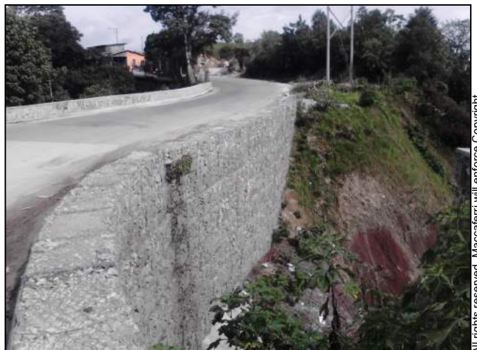
Fig 10. Obra temrinada

Parque Industrial Querétaro km 28.5 Carretera Querétaro-San Luis Potosí Av. San Pedrito No.119 C.P.76220