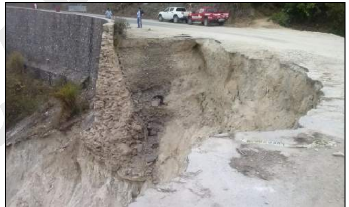
Fig.3 Desprendimiento de masa de tierra en "El Porvenir"