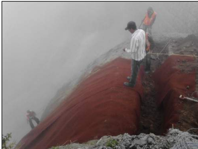
Fig 7. Colocación de MacMat®