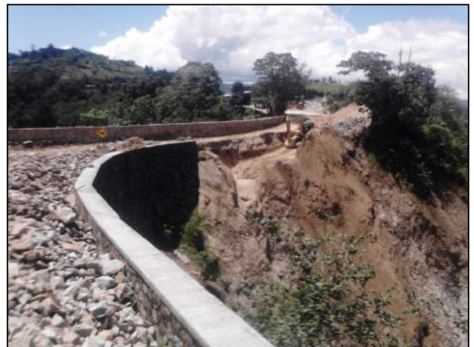
Fig 4. Comienzo de trabajos