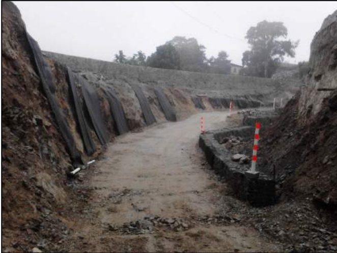
Fig 5. Fase de instalación Sistema Terramesh®