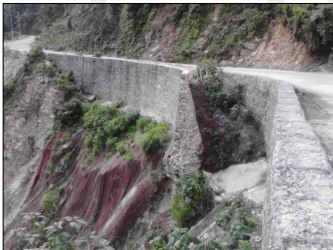
Fig 9. Muro Mecánicamente Estabilizado con Sist. Terramesh®