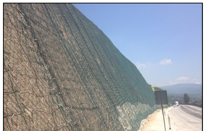
Fig.4 Geomanta anti erosion con malla Rockmesh® B300