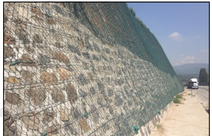
Fig. 3 Malla de alta resistencia Rockmesh® B300