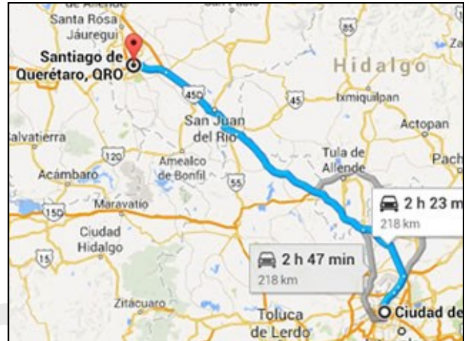
Fig. 2 Carretera México-Qro