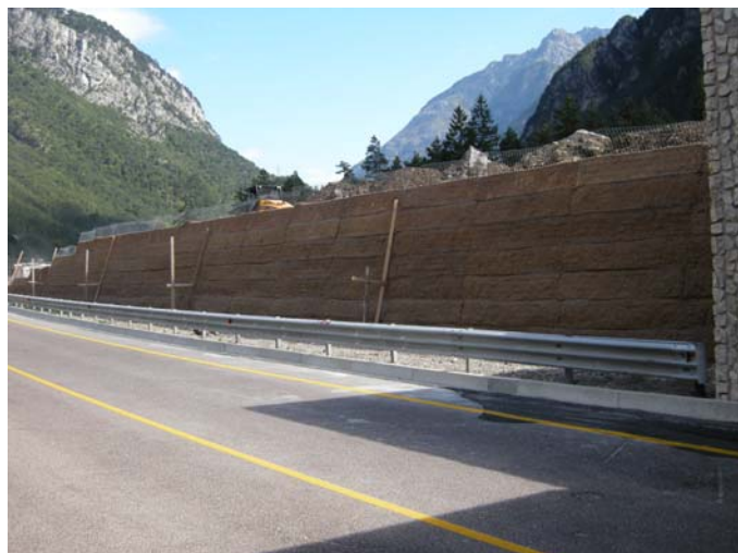
Avanzamento dei lavori