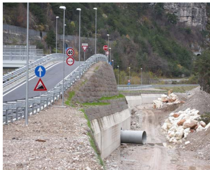
Data: Ottobre 2008