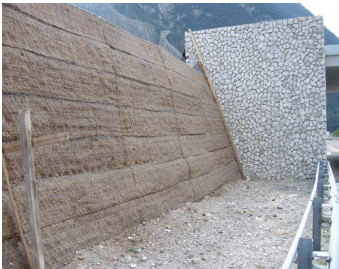
Data: Agosto 2008