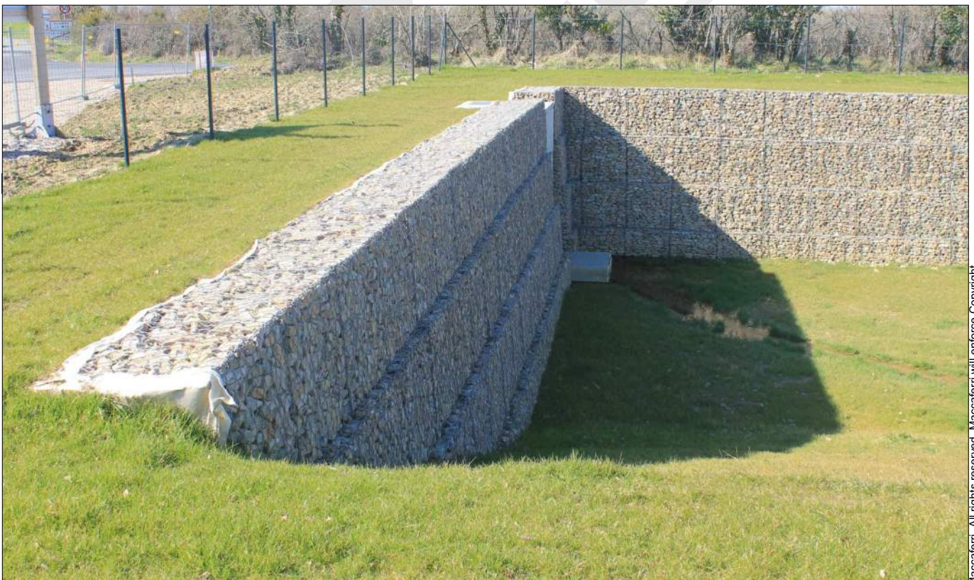
Après les travaux

© 2015 Maccaferri. All rights reserved. Maccaferri will enforce Copyright.