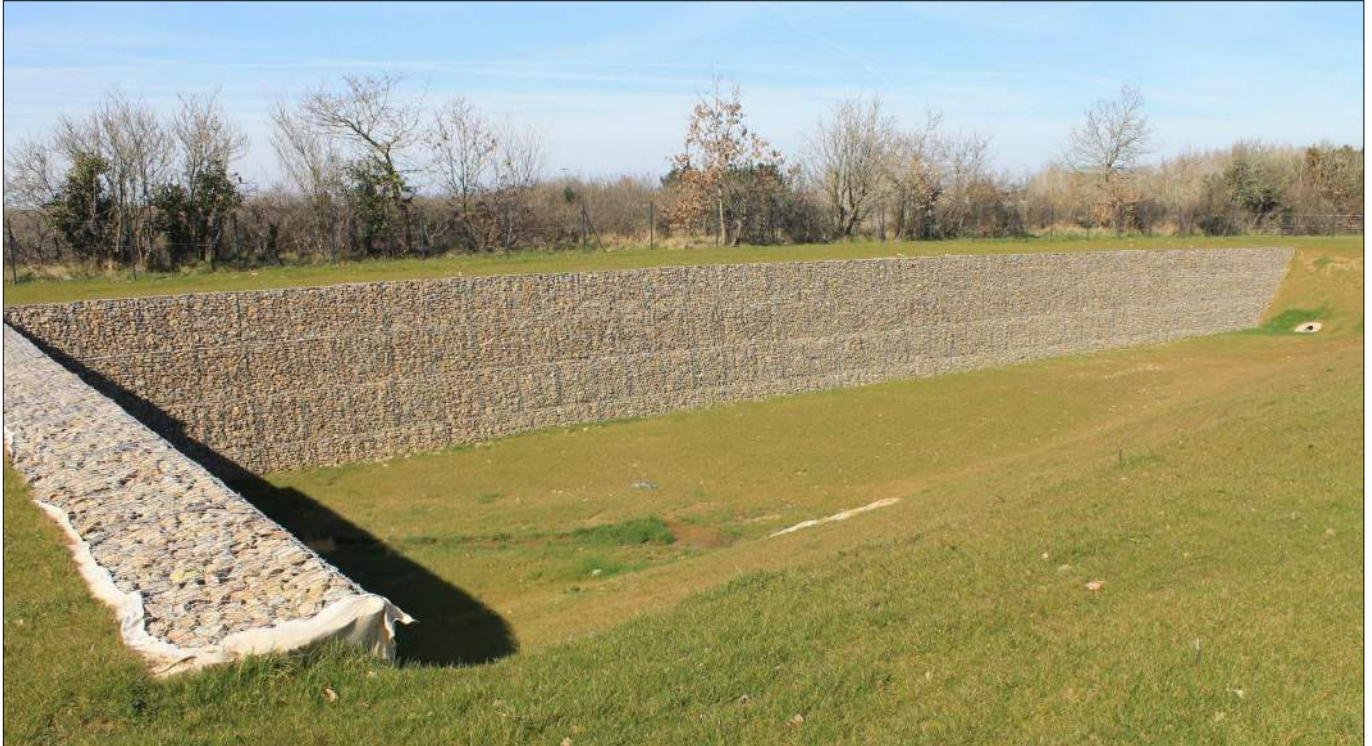
Après les travaux