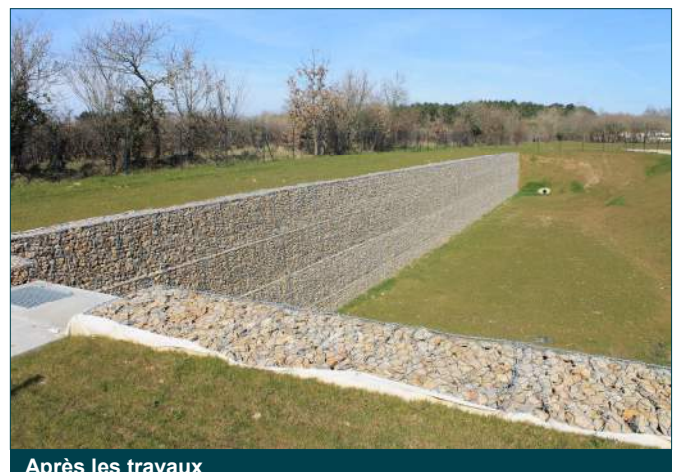
Après les travaux