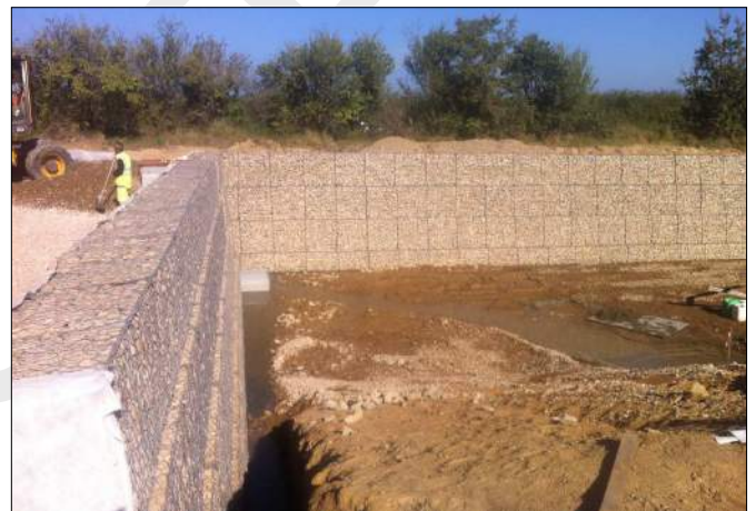
Pendant les travaux