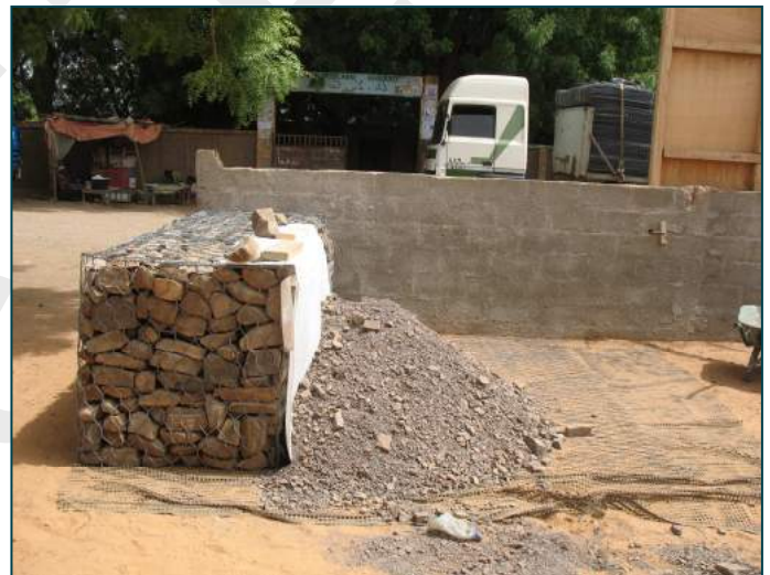
Figure 2 : échantillon Terramesh® system avec nappes