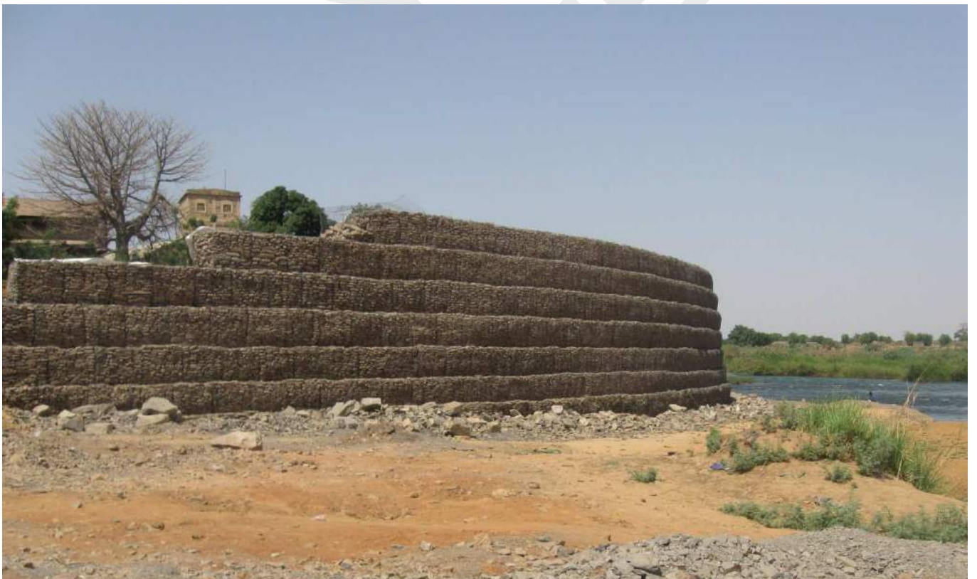
Figure 5 : après les travaux