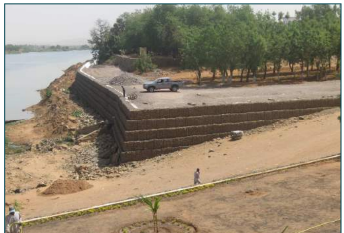
Figure 3 : après les travaux