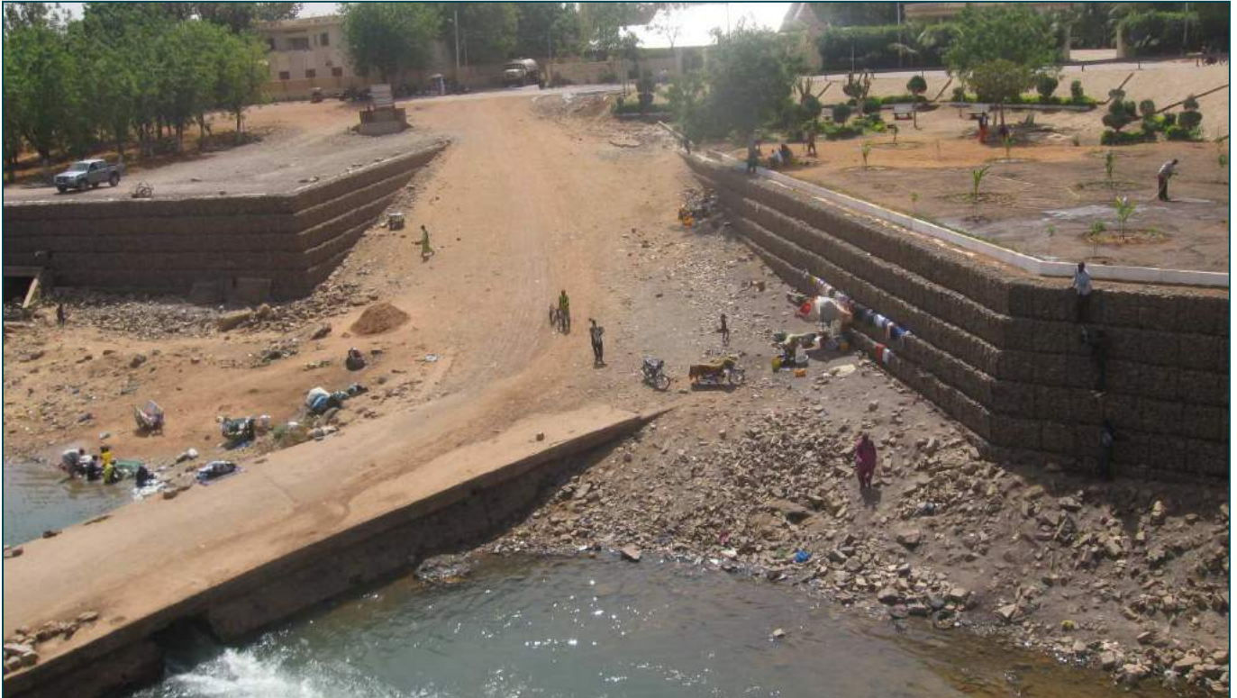
Figure 4 : après les travaux