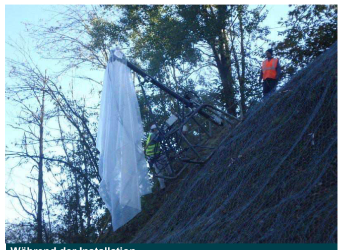
Während der Installation

© 2012 Maccaferri. Alle Rechte vorbehalten. Maccaferri wird das Urheberrecht geltend machen.