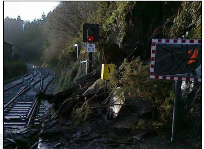
Nach dem Abbruch eines Hanges