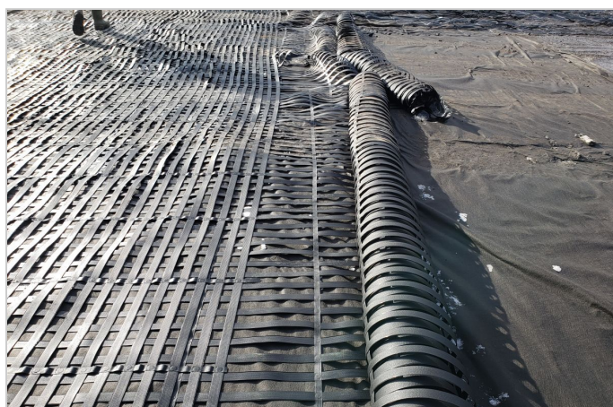
Installation of Paragrid with MacTex MX225