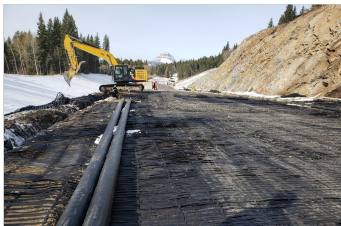
Installation of Paragrid