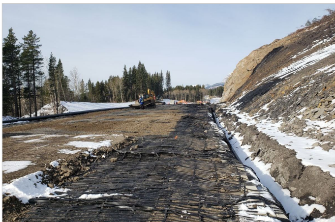
Installation of Paragrid