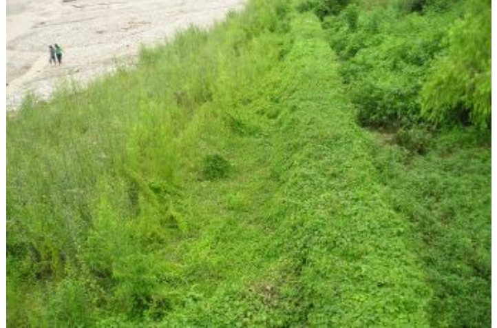
Antes de la Obra

El río Chijra es un afluente del río Grande, que es uno de los ríos más grandes de la provincia de Jujuy. El río Chijra pasa por el medio del pueblo y por esta razón, está rodeado de barrios como Chijra, 9 de Julio, Bajo la Viña y Campo Verde. En estos barrios, las casas están situadas a pocos metros de la orilla del río, y en la temporada de lluvias, este aumenta en gran medida su nivel, causando grandes inundaciones en las regiones al rededor, poniendo en peligro la vida de las personas que viven en estos lugares.