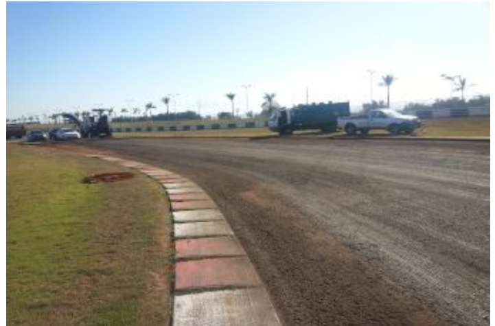
Antes de la Obra

Hubo una aparición de patologías en el recubrimiento flexible de la pista del autódromo, con el desarrollo de grietas y pequeñas depresiones, que comprometían el confort y la seguridad de los usuarios, especialmente en las grandes competencias. La intervención se llevó a cabo con el fin de proteger la base del pavimento un poco viejo, pero todavía en buen estado y extender la vida de la pista. Para combatir las patologías en el momento que aparecen, se evitan futuros daños a la estructura de base, economizando costos y tiempo de restauración.