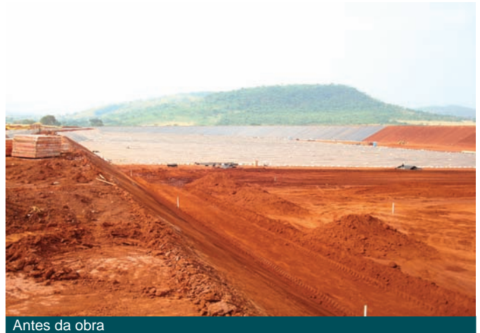
Antes da obra

A Maccaferri foi contratada pela empresa gerenciadora da obra para fiscalizar todas as etapas da obra garantindo assim a procedência do controle de qualidade de instalação.