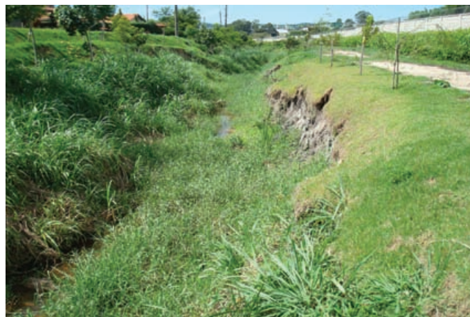
Antes da obra

O excesso do volume de água e a falta de uma calha que comportasse e dissipasse a energia de escoamento das águas de montante criaram focos erosivos em todo canal, além de transbordamentos seguidos de alagamentos em toda área em seu entorno.