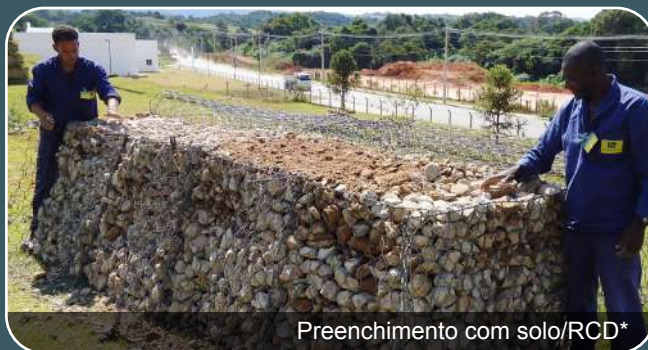
Preenchimento com solo/RCD*