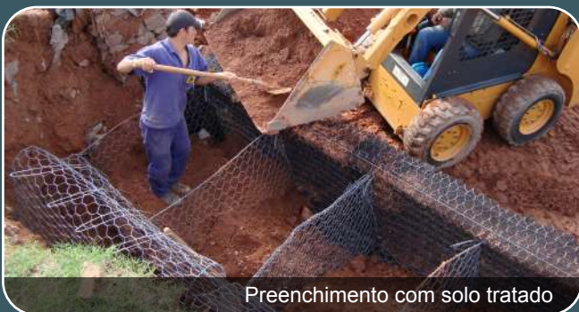
Preenchimento com solo tratado