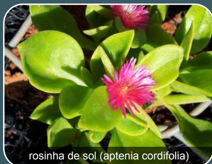
rosinha de sol (aptenia cordifolia)