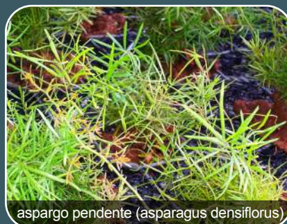
aspargo pendente (asparagus densiflorus)