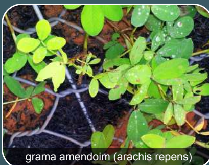
grama amendoim (arachis repens)