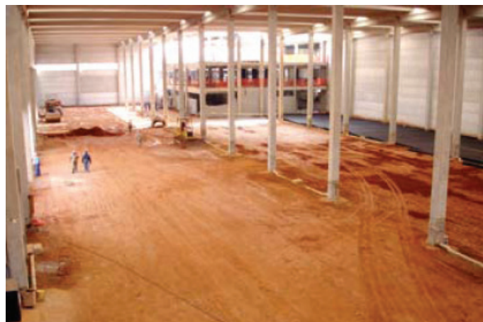
Antes da obra

A aplicação teve total acompanhamento da equipe técnica da Maccaferri para orientação quanto ao nivelamento da base, uso de grampos de fixação, transpasses, proteção contra danos na aplicação e demais detalhes executivos.