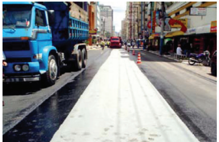
Durante la obra

La UNIVALI – Universidad del Valle del Itajaí con la asistencia de Maccaferri Brasil y aprovechando el programa de recuperación vial, ofrecieron al municipio la posibilidad de realizar un trecho de prueba de repavimentación asfáltica con la aplicación de geotextil no tejido, actuando como elemento separador y antireflector de grietas. Maccaferri asistió la ejecución del trecho de prueba al que asistieron los alumnos de la UNIVALI con el fin de desarrollar un trabajo de fin de curso basado en el experimento realizado. El éxito de la prueba fue el factor determinante para posibilitar la obtención de un banco de datos que posibilitase nuevos trabajos en el área de pavimentos desarrollados por el municipio con la colaboración de la UNIVALI.