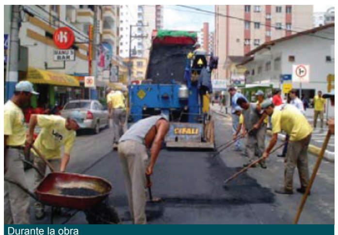
Durante la obra