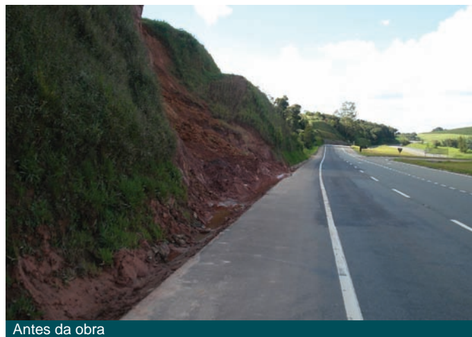
Antes da obra

Foi executado um primeiro muro com 51,00m de extensão e outro com 76,00m, ambos com 4,50 de altura e devido a presença constante de água, foi indicado um lastro de rachão (altura mínima de 0,50m) envelopado com MacTex®, assim como a construção de caneletas de drenagem na base e na crista do muro.