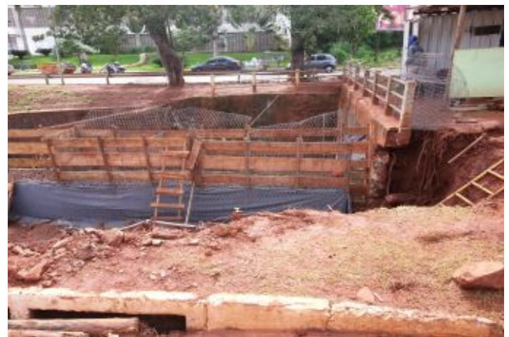
Durante a obra

Com a ruptura do muro e formação da erosão no aterro, uma das pistas marginais ao córrego ficou comprometida, exigindo rápida intervenção. O corpo técnico da Maccaferri foi acionado para auxiliar na solução, dimensionando um muro em gabião para o mesmo local, de tal forma que recuperasse a geometria do canal, bem como o aspecto e as condições hidráulicas. Outro ponto foi o revestimento do fundo erodido, próximo à ala do bueiro, com agulhamento de rachão, colocação do colchão Reno® e posterior argamassamento.