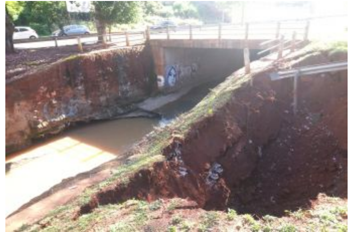
Antes da Obra

O Prosa é um importante córrego que atravessa a capital Campo Grande, ajudando no escoamento da drenagem pluvial de parte da cidade. Canalizado há alguns anos, hoje passa pelo canal uma vazão maior do que a projetada à época, necessitando de manutenção periódica em pontos danificados pela energia das águas da chuva. Um desses pontos fica à jusante de um bueiro celular, onde após forte chuva, trabalhou afogado, alterando o regime de escoamento do canal e danificando o colchão Reno do fundo. Por consequência houve o solapamento do muro de uma das margens.