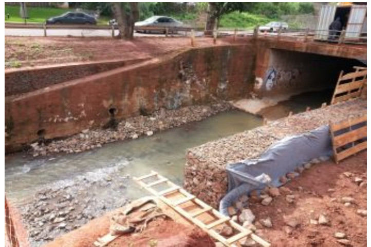
Durante a obra