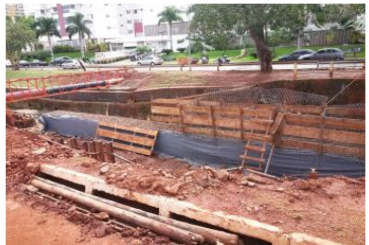
Durante a obra