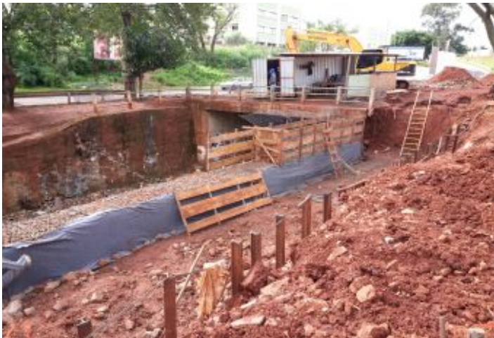
Durante a obra