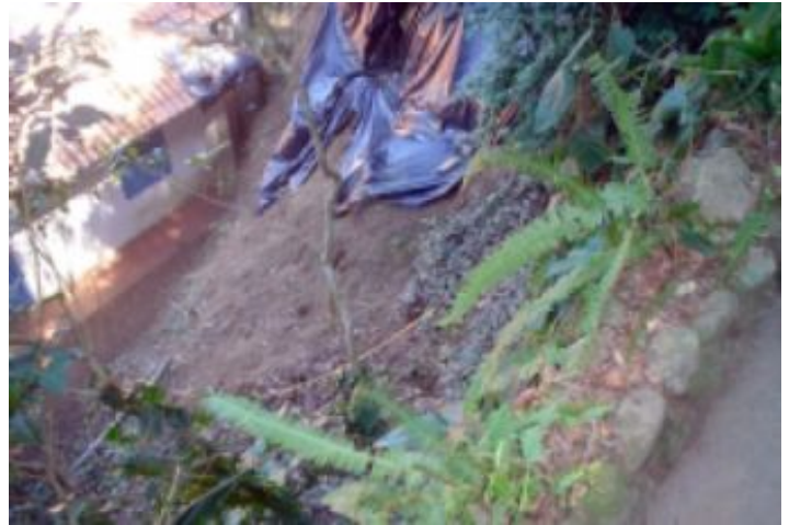
Antes da Obra

Devido às fortes chuvas do verão de 2005, no litoral norte do Estado de São Paulo, o município de São Sebastião foi afetado, em alguns pontos, pela ocorrência de fenômenos erosivos. Um deles ocorreu em uma das propriedades particulares da praia de Maresias. Essa propriedade se encontra ao “pé” de um talude que sofreu um deslizamento superficial e foi colocada em situação de risco, necessitando, portanto, de uma intervenção rápida e eficiente.