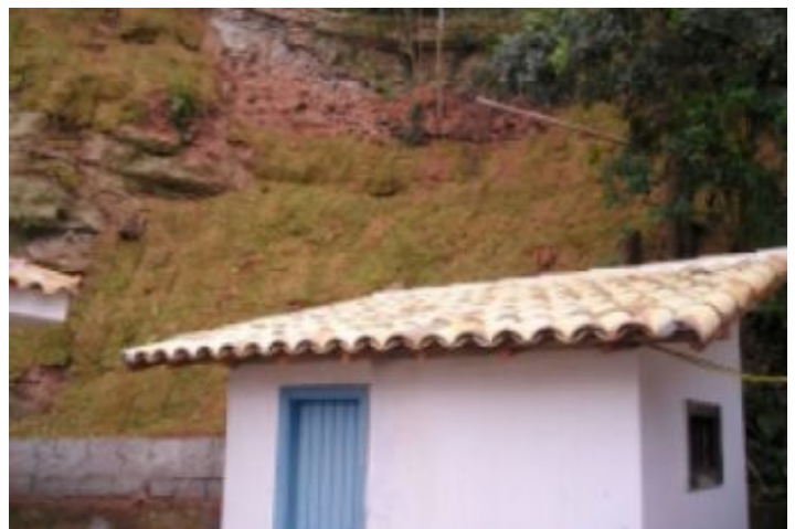
Antes da Obra

Durante visita ao local constatou-se que o talude apresentava uma inclinação e estava muito próximo da edificação, descartando a possibilidade da utilização de uma estrutura de contenção para deter o fenômeno. Optou-se então, por uma solução baseada na obturação, restauração e proteção do talude através de placas de grama e Geomanta MacMat®, que é uma manta tridimensional de filamentos de polipropileno, cuja estrutura apresenta mais de 90% de vazios. Após dois meses da implantação o talude já apresentava uma condição estável e estava revegetado.