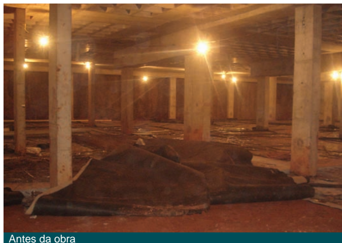
Antes da obra