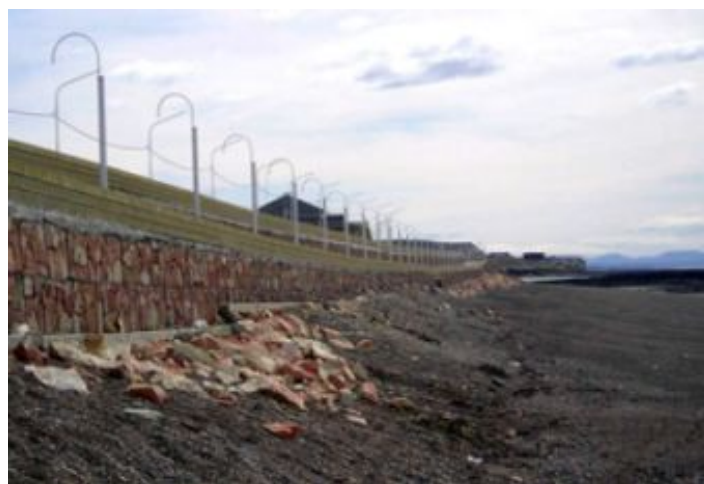
Durante a obra