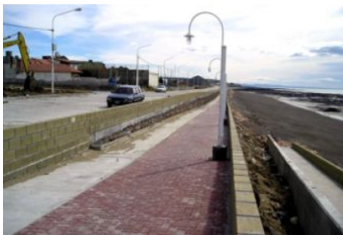
Durante a obra