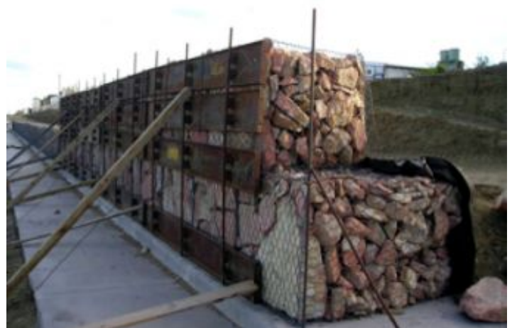
Durante a obra