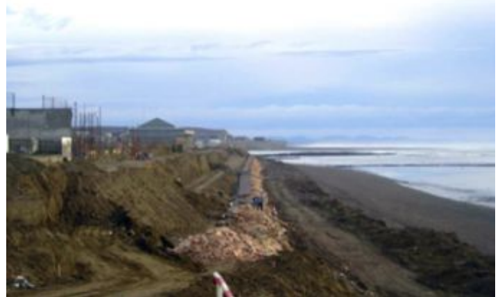
Durante a obra

Optou-se pela solução em gabões revestidos com PVC, onde a solução consiste em uma base de 3m de altura de enrocamento, que suporta o impacto direto das ondas, sobre esta, apoia-se o muro de gabões de 2m de altura, que trabalha como contenção de uma passarela de pedestres e de uma ciclovia. Desta maneira, conseguiu-se substituir a estrutura de estacas-pranchas por uma solução que não apenas cumpriu com os requisitos técnicos e econômicos da obra, mas também agregou um aspecto visual agradável ao local.