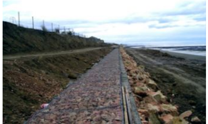
Durante a obra

A erosão marítima provocada pelo impacto das ondas do mar acarretava riscos à margem costeira da cidade de Caleta Olívia, na Província de Sta. Cruz, localizada no extremo sul da Argentina. O projeto original de proteção contemplava a construção de 400m lineares de estacas-pranchas metálicas. O custo elevado e as complicações construtivas desta solução obrigaram a prefeitura local a procurar uma alternativa mais viável em termos técnicos e econômicos para a restauração da costa litorânea de Caleta.