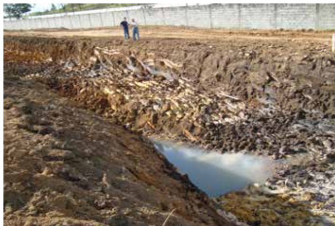
Antes da obra

Após a execução da obra, as soluções propostas se mostraram eficazes, seguras, e permitiram a construção do pátio de manobras dentro do cronograma de execução da obra.